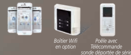
Boîtier Wifi en option

Cette application peut être installée sur plusieurs téléphones.